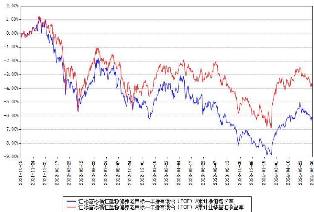
汇添富添福汇盈稳健养老目标一年持有混合（FOF）Y 累计净值增长率与同期业绩基准收益率对比图