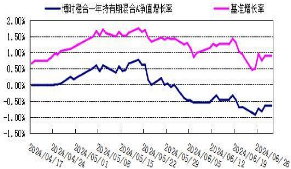
博时稳合一年持有期混合 C