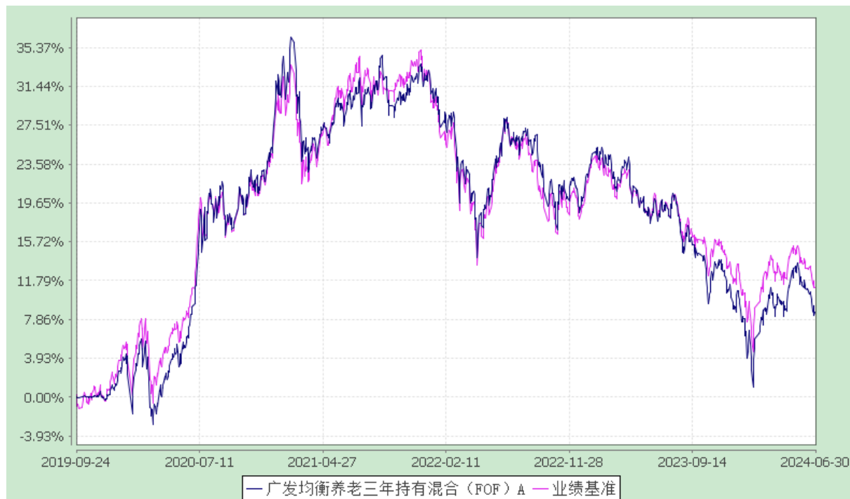
广发均衡养老三年持有混合（FOF）Y