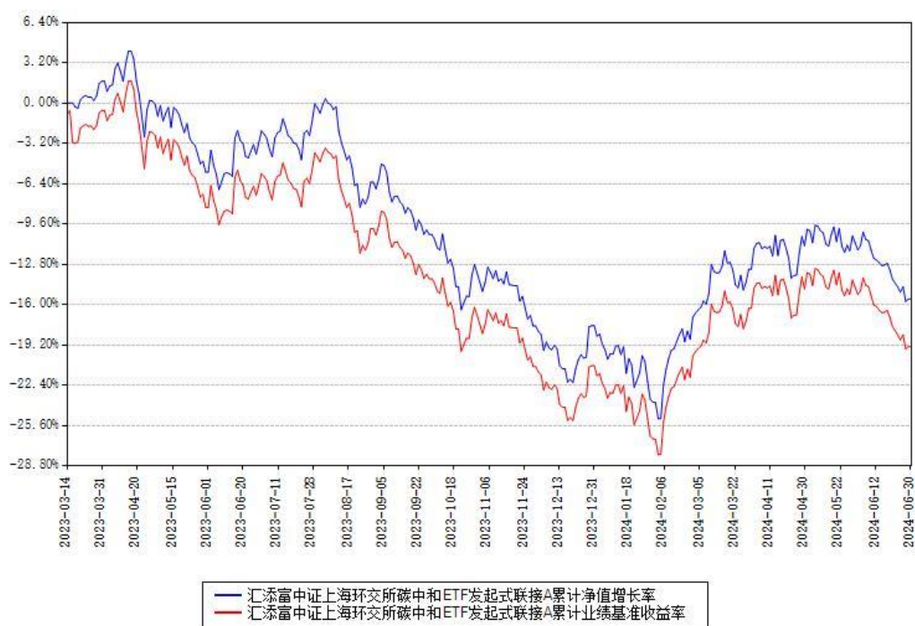
汇添富中证上海环交所碳中和ETF发起式联接A累计净值增长率与同期业绩比较基准收益率对比图