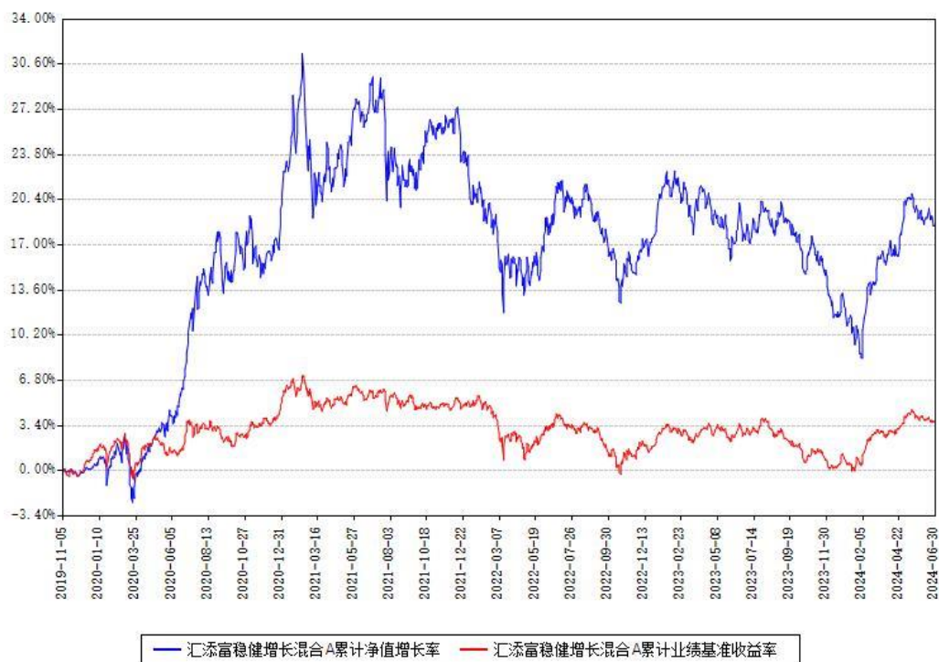
汇添富稳健增长混合A累计净值增长率与同期业绩基准收益率对比图