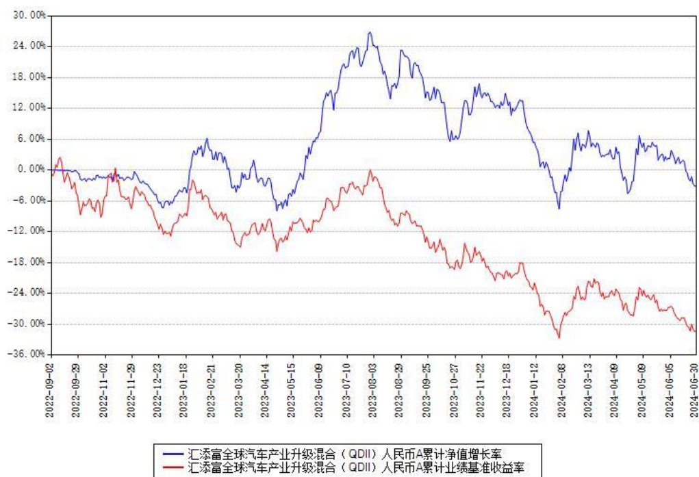
汇添富全球汽车产业升级混合（QDII）人民币A累计净值增长率与同期业绩基准收益率对比图