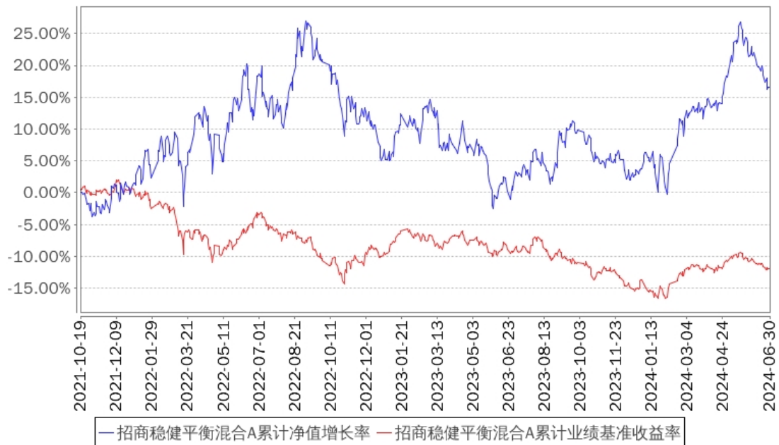
招商稳健平衡混合A累计净值增长率与同期业绩比较基准收益率的历史走势对比图