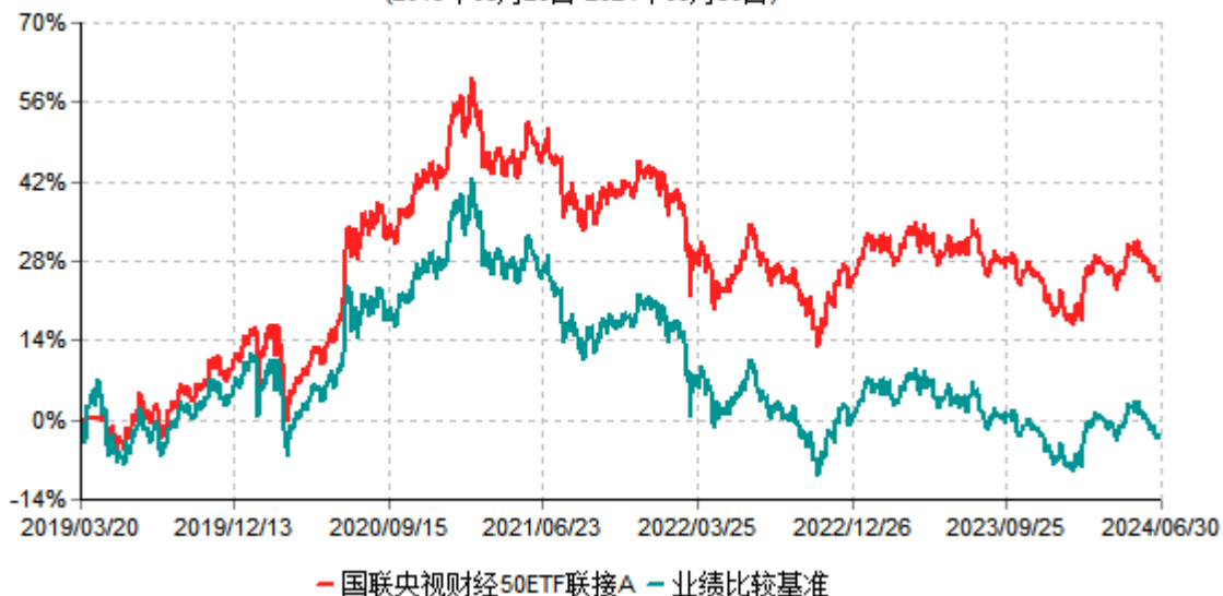
国联央视财经50ETF联接A累计净值增长率与业绩比较基准收益率历史走势对比图 (2019年03月20日-2024年06月30日)