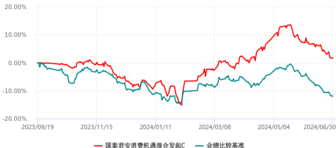
国泰君安消费机遇混合发起C累计净值增长率与业绩比较基准收益率历史走势对比图 (2023年09月19日-2024年06月30日)

注：1、本基金于 2023 年 09 月 19 日成立，自合同生效日起至本报告期末不足一年。