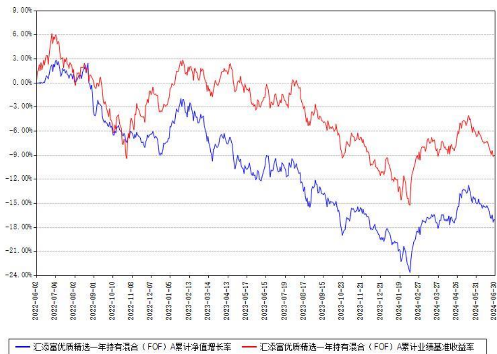
汇添富优质精选一年持有混合（FOF）A累计净值增长率与同期业绩基准收益率对比图