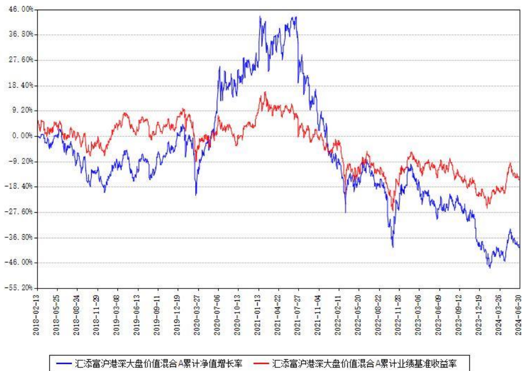
汇添富沪港深大盘价值混合A累计净值增长率与同期业绩基准收益率对比图