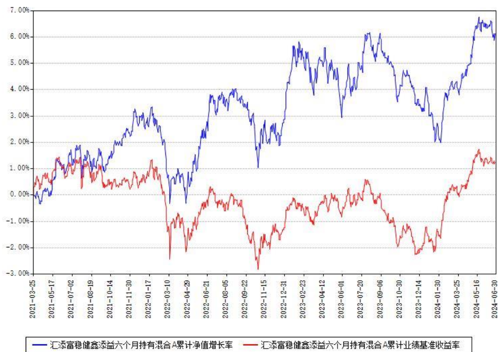
汇添富稳健鑫添益六个月持有混合A累计净值增长率与同期业绩比较基准收益率对比图