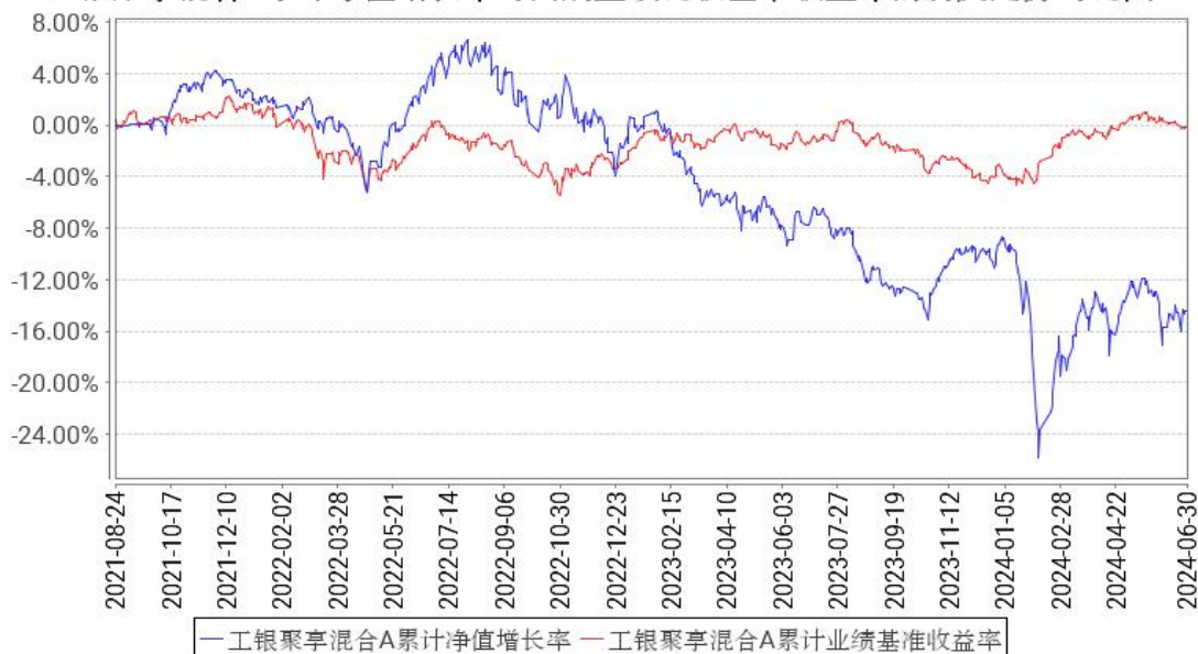
工银聚享混合A累计净值增长率与同期业绩比较基准收益率的历史走势对比图