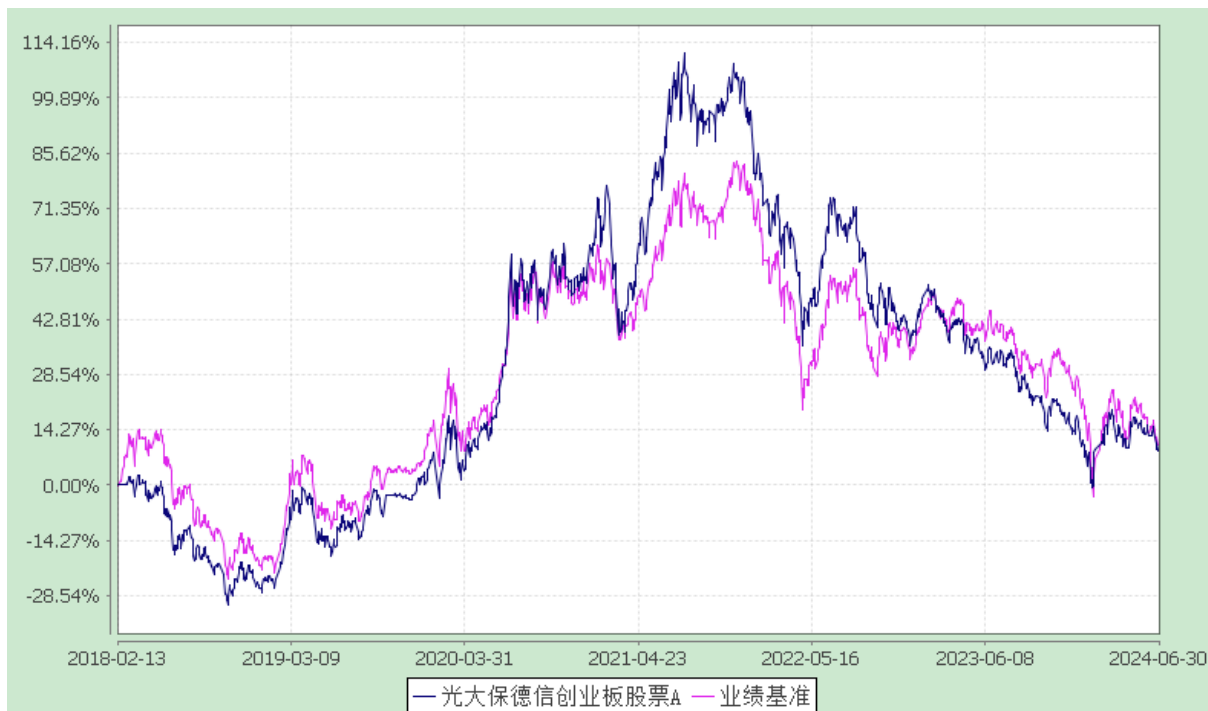
光大保德信创业板股票 C