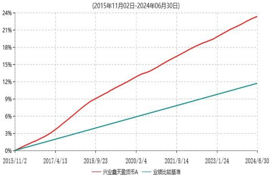
兴业鑫天盈货币A累计净值收益率与业绩比较基准收益率历史走势对比图