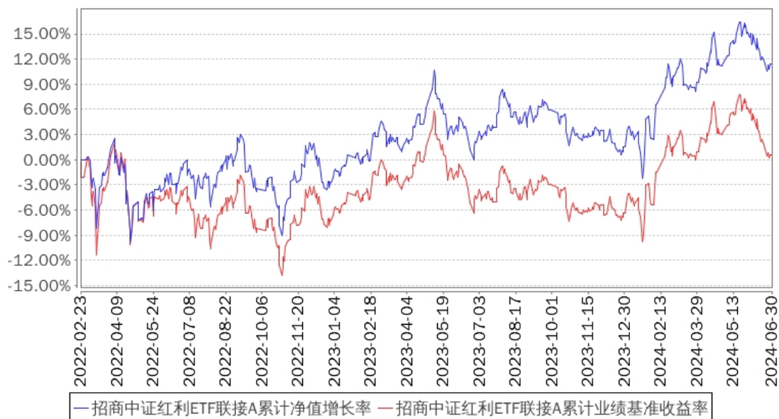
招商中证红利ETF联接A累计净值增长率与同期业绩比较基准收益率的历史走势对比图