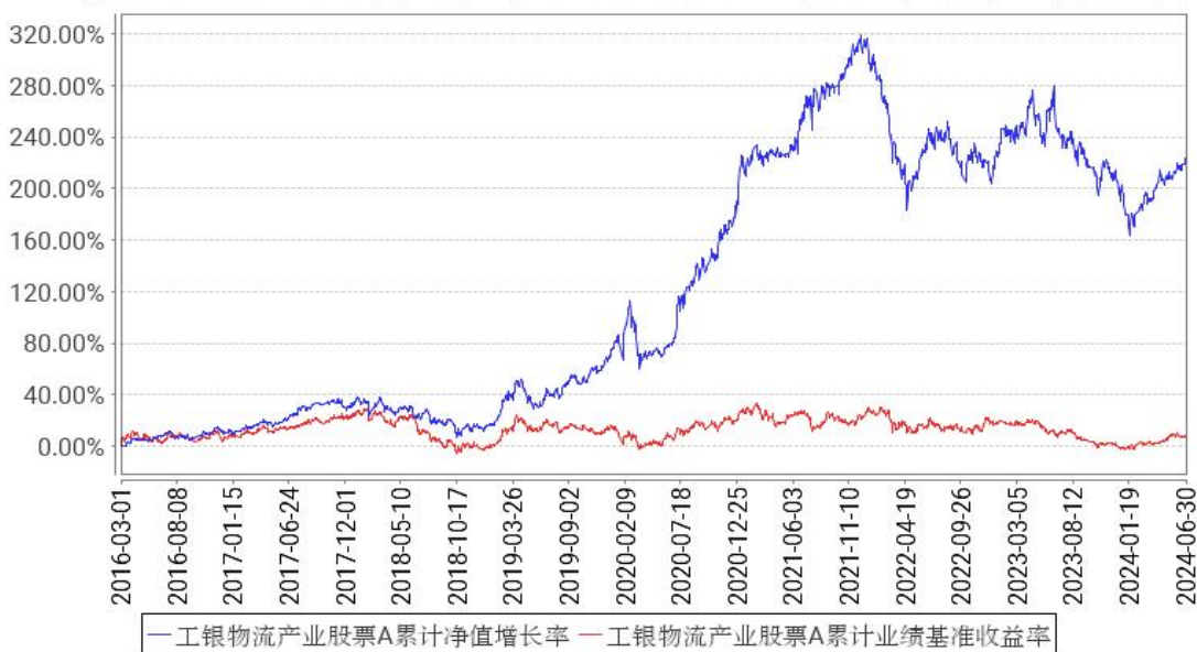
工银物流产业股票A累计净值增长率与同期业绩比较基准收益率的历史走势对比图