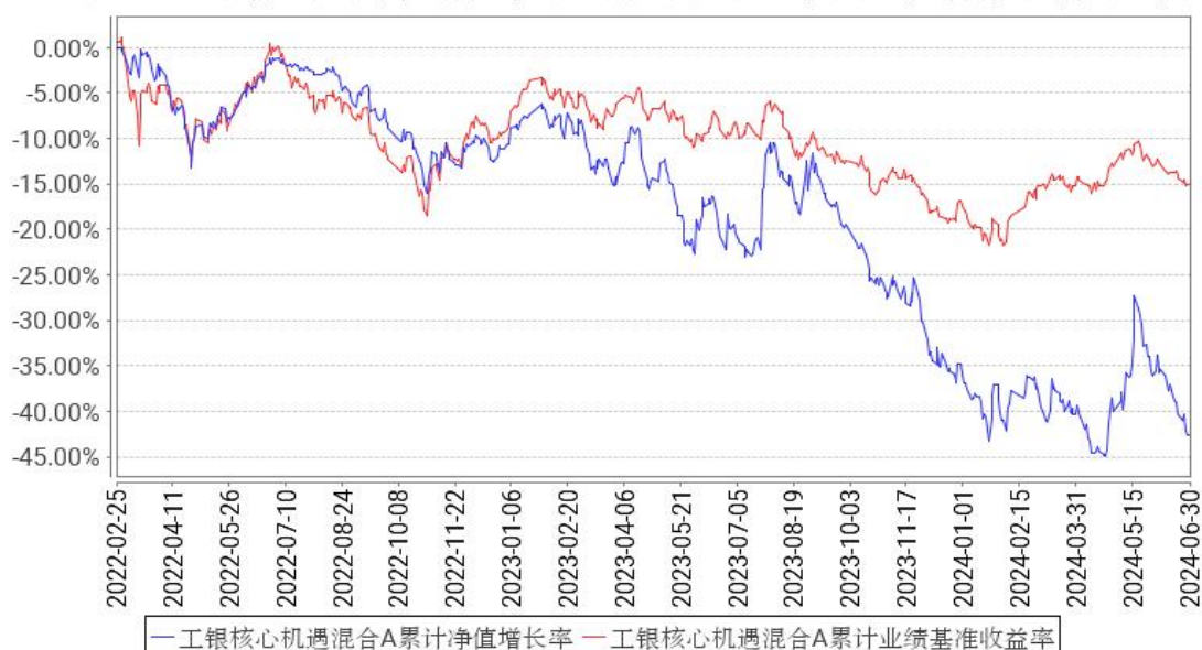
工银核心机遇混合A累计净值增长率与同期业绩比较基准收益率的历史走势对比图