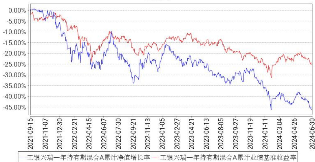
工银兴瑞一年持有期混合A累计净值增长率与同期业绩比较基准收益率的历史走势对比图