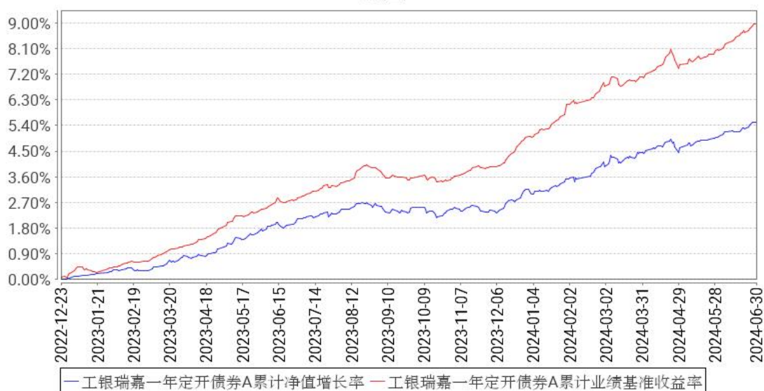
工银瑞嘉一年定开债券A累计净值增长率与同期业绩比较基准收益率的历史走势对比图