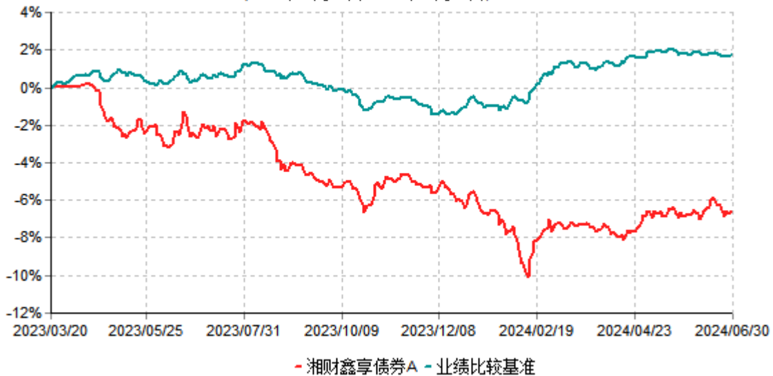
湘财鑫享债券A累计净值增长率与业绩比较基准收益率历史走势对比图 (2023年03月20日-2024年06月30日)