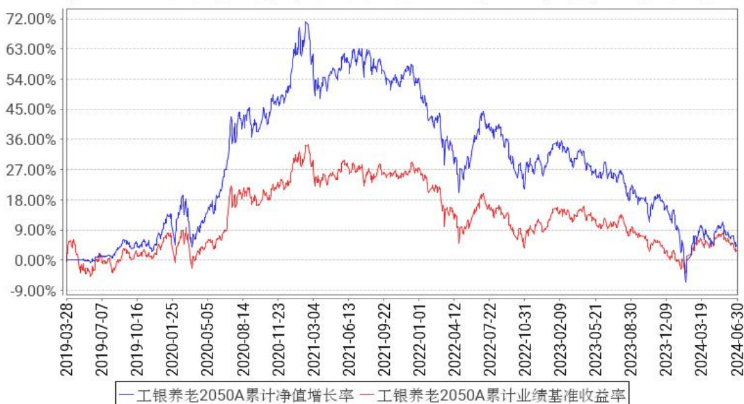
工银养老2050A累计净值增长率与同期业绩比较基准收益率的历史走势对比图