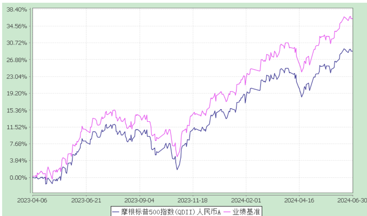
摩根标普 500 指数(QDII)人民币 A 份额累计净值增长率与业绩比较基准收益率的历史走势对比图 (2023 年 4 月 6 日至 2024 年 6 月 30 日)

注：本基金合同生效日为 2023 年 4 月 6 日，图示的时间段为合同生效日至本报告期末。