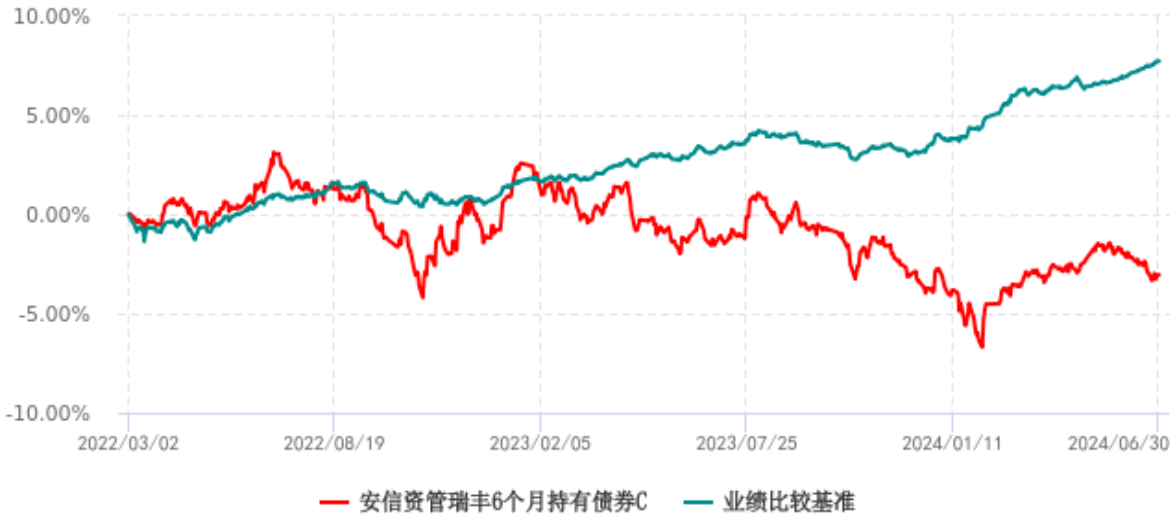
安信资管瑞丰6个月持有债券C累计净值增长率与业绩比较基准收益率历史走势对比图 (2022年03月02日-2024年06月30日)

注：安信资管瑞丰 6 个月持有债券 C（970092）2 月 28 日尚未开放申赎，无计划份额，2022 年 2 月 28 日净值不进行披露。