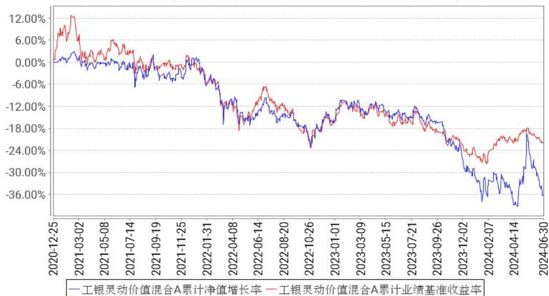
工银灵动价值混合A累计净值增长率与同期业绩比较基准收益率的历史走势对比图