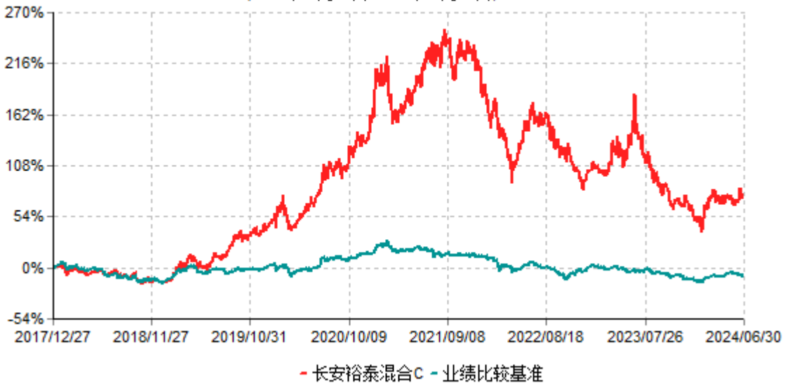
长安裕泰混合C累计净值增长率与业绩比较基准收益率历史走势对比图 (2017年12月27日-2024年06月30日)

根据基金合同的规定,自基金合同生效之日起6个月内基金各项资产配置比例需符合基金合同要求。本基金在建仓期结束后,各项资产配置比例已符合基金合同有关投资比例的约定。基金合同生效日至报告期期末,本基金运作时间超过一年。图示日期为2017年12月27日至2024年6月30日。