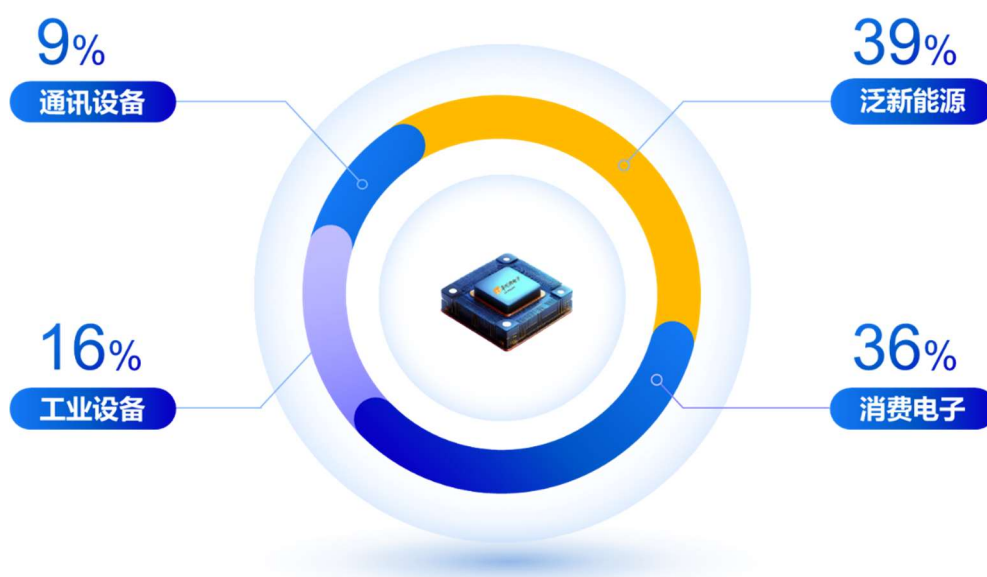
图 2： 2024 年上半年公司产品与方案板块下游终端应用情况

公司积极响应市场发展趋势，聚焦产品在终端应用领域的高端化转型，技术实力与市场份额同步攀升。报告期内，公司在新能源及汽车电子领域取得了令人瞩目的成绩，泛新能源领域在公司产品与方案板块占比达到了 39%。其中，在汽车电子领域，公司已与多家头部整车厂、Tier1 厂商形成了战略合作关系，推出包括 MOSFET、IGBT、SiC、功率 IC 等在内的系列化功率类和驱动类车规级产品，批量应用于动力、底盘、车身、辅助驾驶等多数整车应用场景。