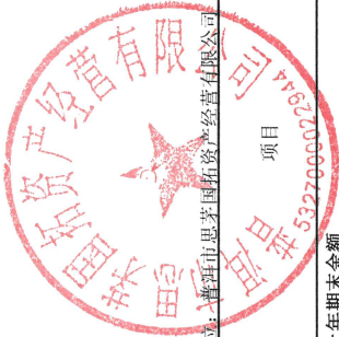
母公司所有者权益变动表 2023年1-6月