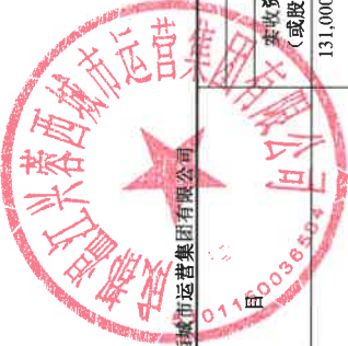
合并所有者权益变动表 2024年1-6月