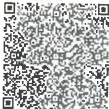
有激活的年检二维码

本证书经检验合格，继续有效一年。 This certificate is valid for another year after this renewal.