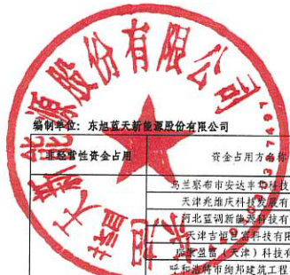
东旭蓝天新能源股份有限公司2024年1-6月非经营性资金占用及其他关联资金往来情况汇总表