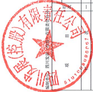
母公司所有者(或股东)权益变动表(续)