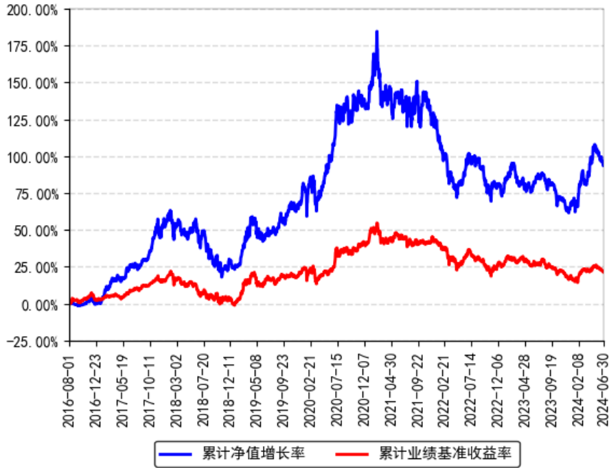
南方品质优选灵活配置混合A累计净值增长率与同期业绩比较基准收益率的历史走势对比图