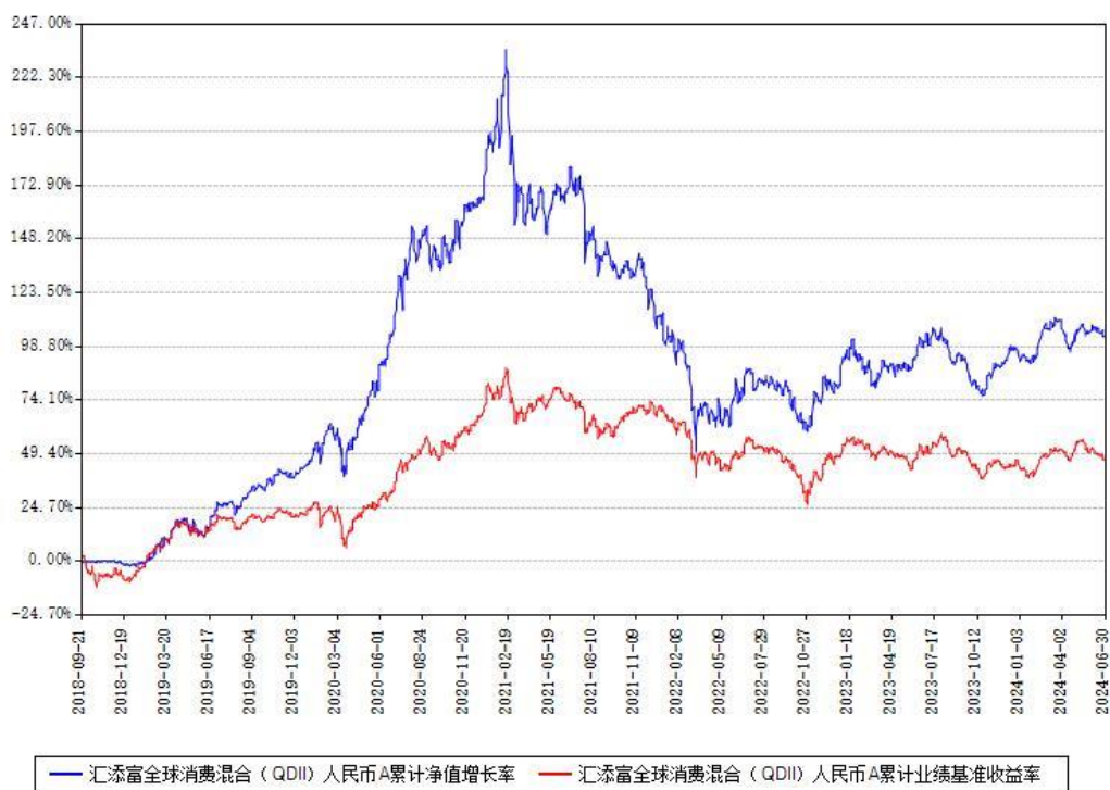
汇添富全球消费混合（QDII）人民币C累计净值增长率与同期业绩基准收益率对比图