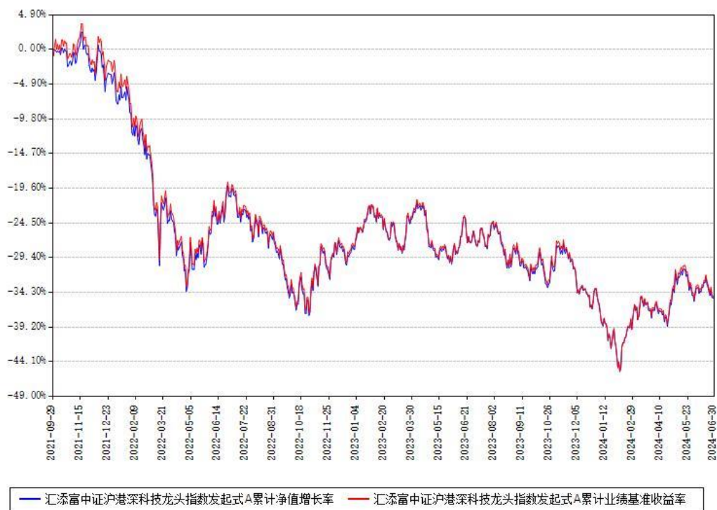
汇添富中证沪港深科技龙头指数发起式A累计净值增长率与同期业绩基准收益率对比图