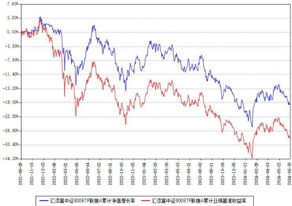
汇添富中证800ETF联接A累计净值增长率与同期业绩基准收益率对比图

（二）自基金合同生效以来基金累计净值增长率变动及其与同期业绩比较基准收益率变动的比较图