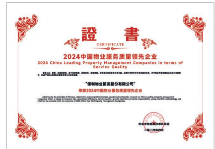
2024 中國物業服務質量領先企業