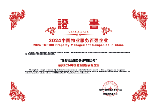
2024 中國物業服務百強企業 (Top 2)