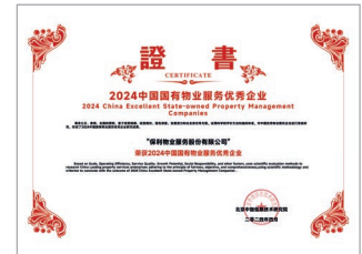
2024 中國國有物業服務優秀企業