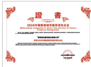
2024 中國智慧城市服務領先企業