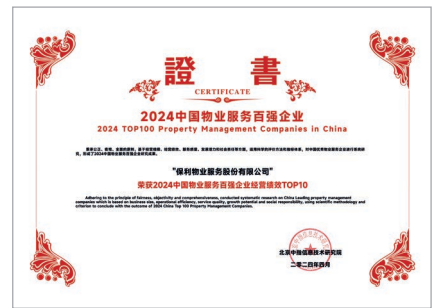
2024 中國物業服務百強企業經營績效TOP10