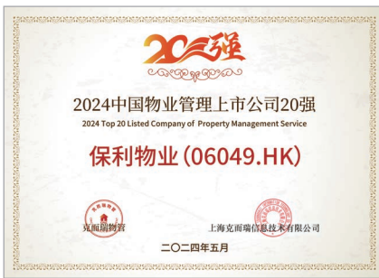
2024 中國物業管理上市公司20強