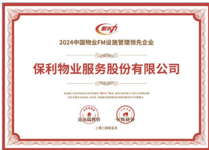
2024 中國物業FM設施管理領先企業