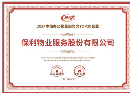
2024 中國辦公物業服務力TOP20企業