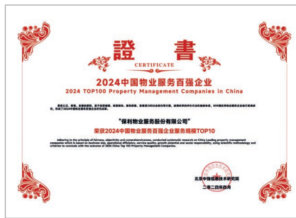
2024 中國物業服務百強企業服務規模TOP10