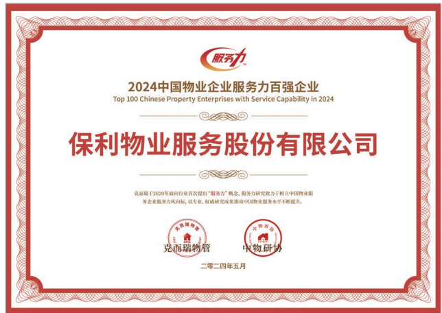
2024 中國物業服務綜合實力百強企業 第2名 2024 中國物業高品質服務力百強企業 2024 中國物業企業服務力百強企業 (Top 2)