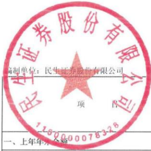
母公司股东权益变动表（续）