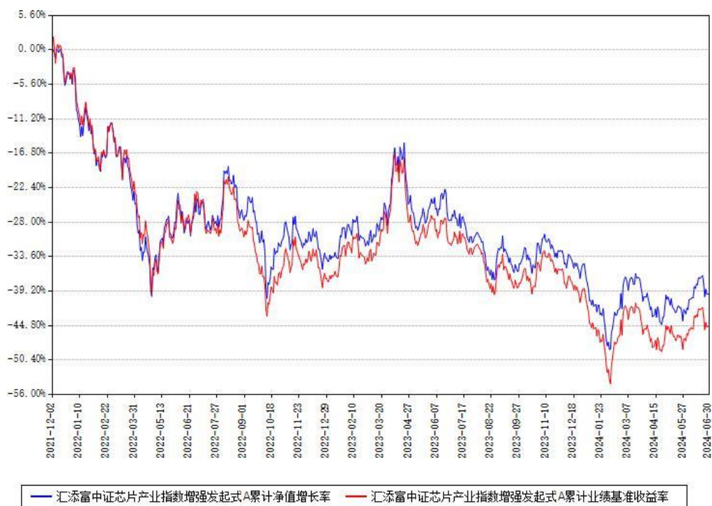
汇添富中证芯片产业指数增强发起式A累计净值增长率与同期业绩基准收益率对比图