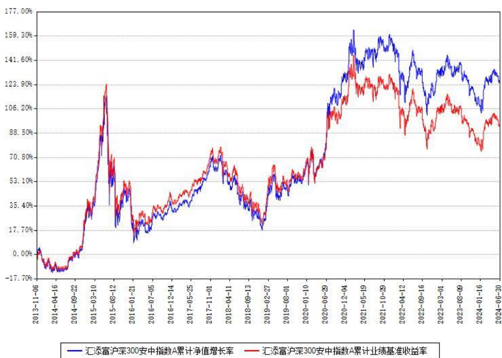
汇添富沪深300安中指数A累计净值增长率与同期业绩基准收益率对比图