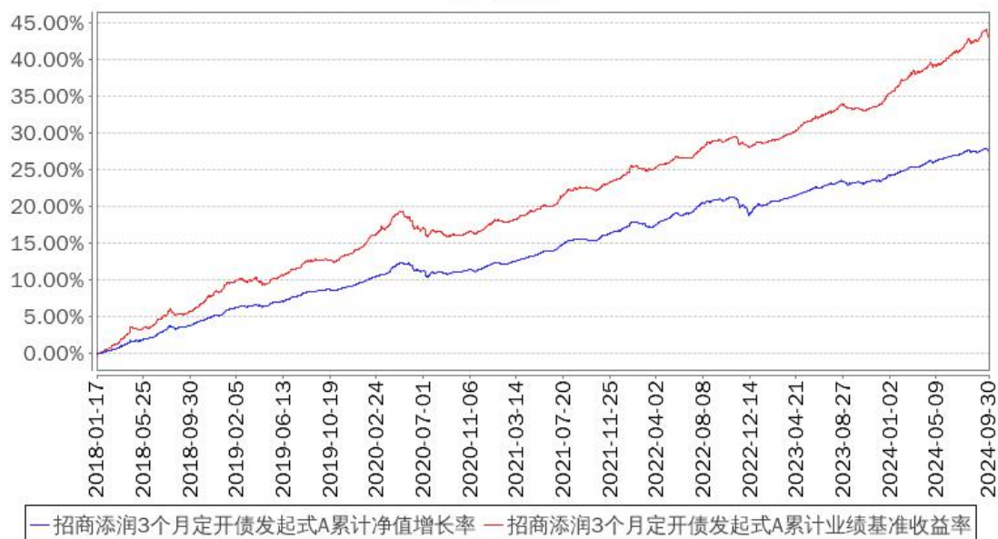
招商添润3个月定开债发起式A累计净值增长率与同期业绩比较基准收益率的历史走势对比图