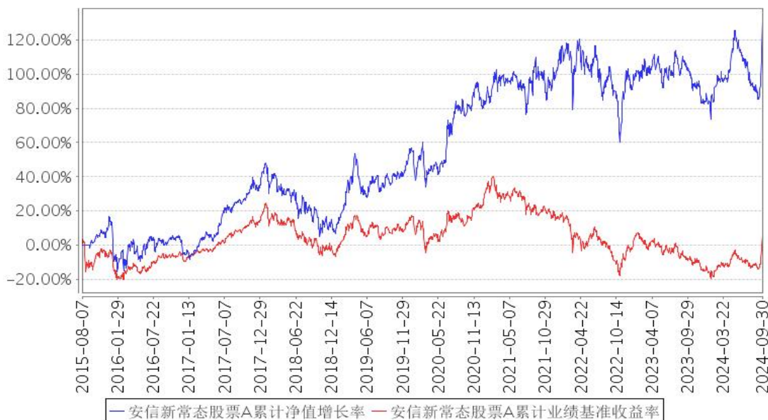
安信新常态股票A累计净值增长率与同期业绩比较基准收益率的历史走势对比图