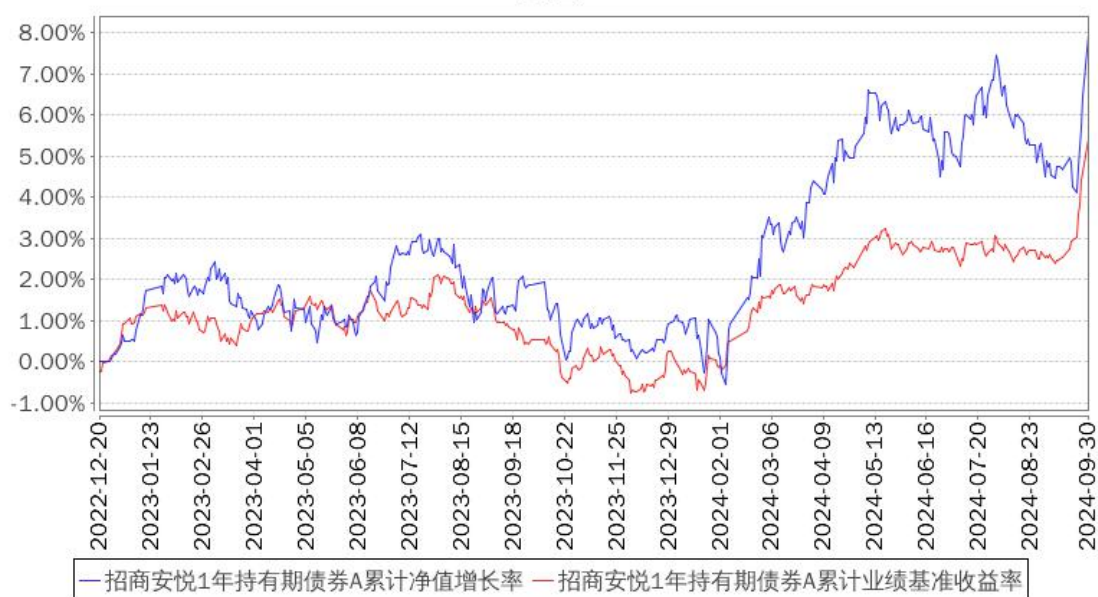
招商安悦1年持有期债券A累计净值增长率与同期业绩比较基准收益率的历史走势对比图