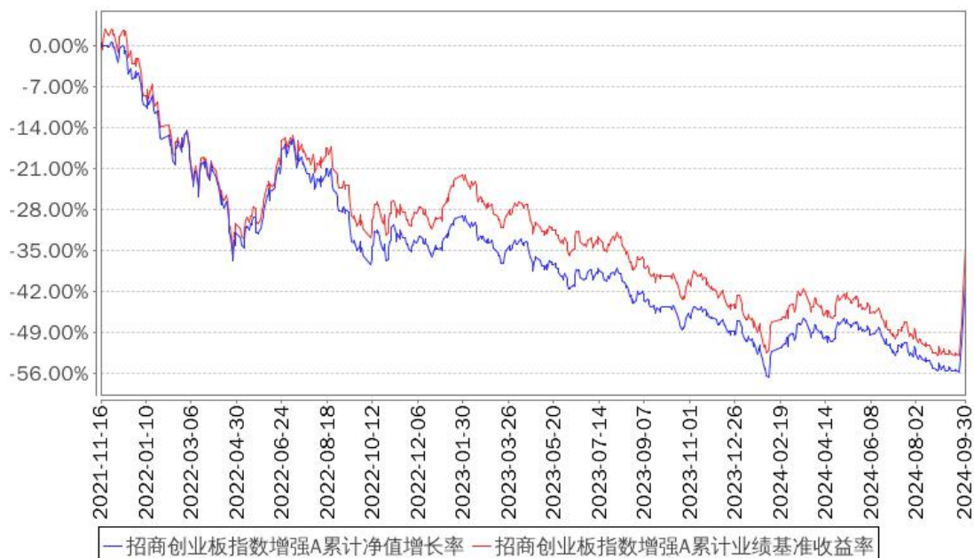
招商创业板指数增强A累计净值增长率与同期业绩比较基准收益率的历史走势对比图