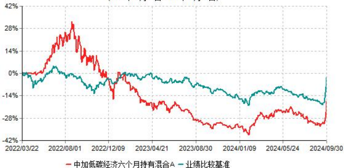
中加低碳经济六个月持有混合A累计净值增长率与业绩比较基准收益率历史走势对比图 (2022年03月22日-2024年09月30日)