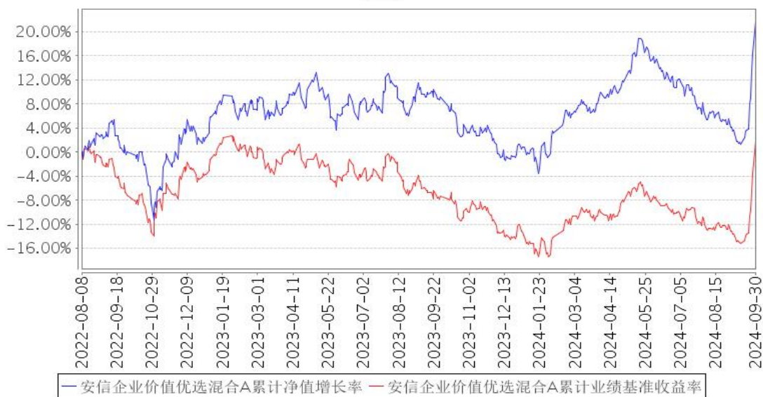
安信企业价值优选混合A累计净值增长率与同期业绩比较基准收益率的历史走势对比图