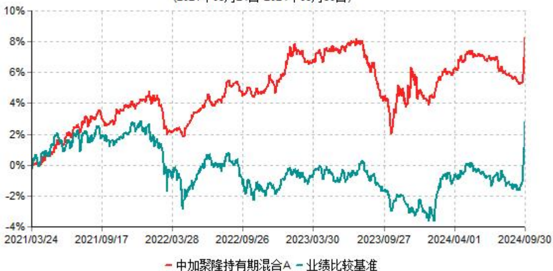
中加聚隆持有期混合A累计净值增长率与业绩比较基准收益率历史走势对比图 (2021年03月24日-2024年09月30日)