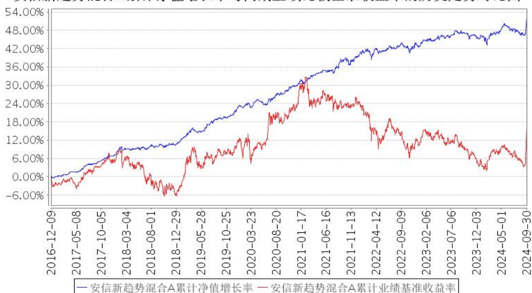
安信新趋势混合A累计净值增长率与同期业绩比较基准收益率的历史走势对比图