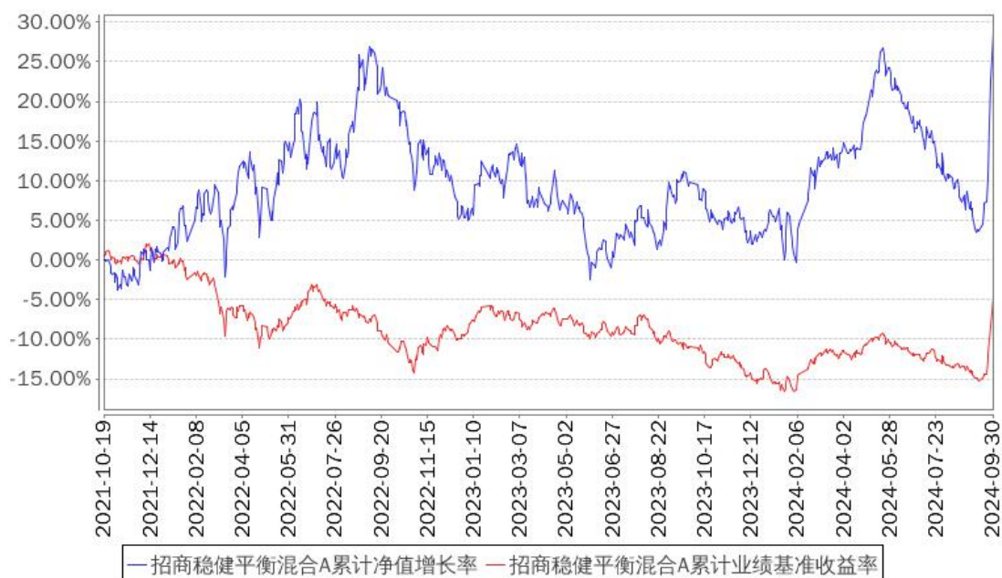
招商稳健平衡混合A累计净值增长率与同期业绩比较基准收益率的历史走势对比图