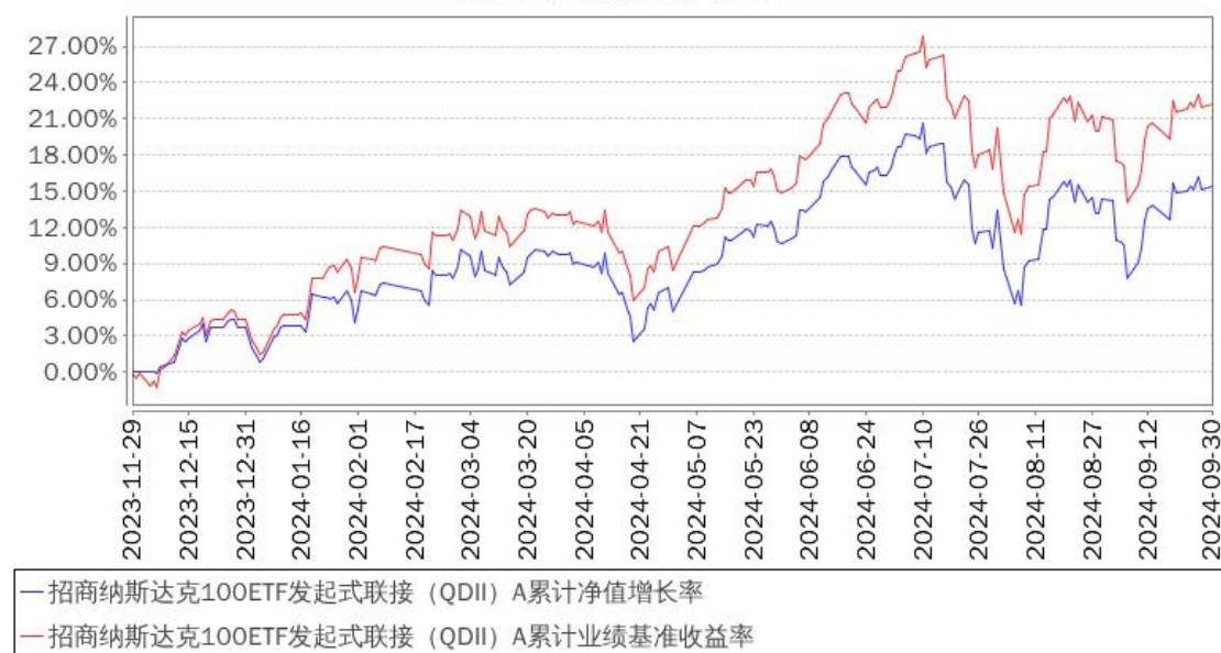
招商纳斯达克100ETF发起式联接 (QDII) A累计净值增长率与同期业绩比较基准收益率的历史走势对比图